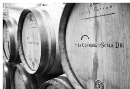
La Conreria d'Scala Dei.