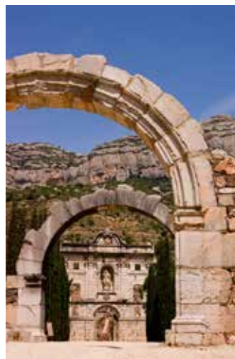
E'Scala Dei. Här finns bland annat ett kloster från 1300-talet.