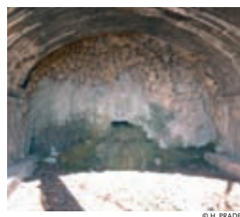
Imagen de la Capilla del Obispo.