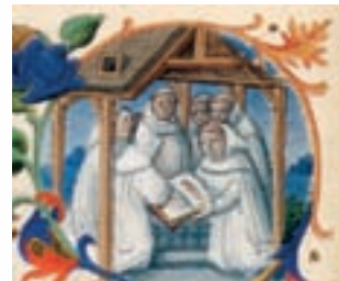
Miniatura de san Bruno con sus compañeros en la cartuja, extraída del libro Les très riches heures du duc de Berry .

EL CONJUNTO MONUMENTAL DE LA CARTUJA DE SANTA MARIA D'ESCALADEI SE HALLA EN EL RECOGIDO VALLE DE L'OLIVER, AL ABRIGO DE LOS RISCOS DE CONGLOMERADOS CALCÁREOS, EN UNO DE LOS PARAJES MÁS SIGNIFICATIVOS DEL PARQUE NATURAL DE LA SIERRA DE MONTSANT. DIVERSAS ESTRUCTURAS DE GRAN INTERÉS HISTÓRICO RODEAN LA CARTUJA. PARA PODER CONOCER MÁS A FONDO LA FORMA DE VIDA DE LOS CARTUJOS Y LAS TRANSFORMACIONES QUE INTRODUJERON EN EL PAISAJE, LES ANIMAMOS A REALIZAR ESTE ITINERARIO CIRCULAR. CON UN CIERTO ESFUERZO, PODRÁN HACERSE A LA IDEA DE QUE FORMAN PARTE DEL SÉQUITO DE MONJES CARTUJOS DURANTE EL PASEO SEMANAL QUE PRESCRIBE LA REGLA DE SAN BRUNO. EL RECORRIDO SE INICIA EN EL EXTERIOR DE LA CARTUJA. HAY QUE TOMAR LA PISTA AGROPECUARIA QUE SALE A LA IZQUIERDA DEL MONUMENTO.