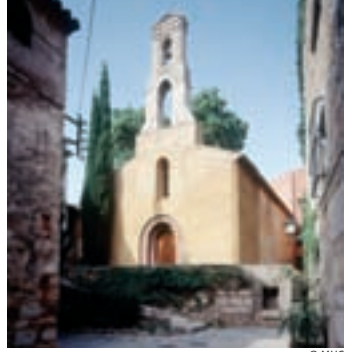
Imagen de la Conreria de Escaladei, una granja.

Fue reformada en el siglo XVII. El resto era un conjunto de edificios de trabajo: almacenes, cuadras, caballerizas, bodega, molino de aceite, etc., y algunas estancias que alojaban a procuradores y menestrales. Actualmente, Escaladei es un núcleo de población del municipio de La Morera de Montsant. Sigue siendo el corazón vitivinícola del Priorat gracias a la actividad de diversas bodegas que han mantenido, a lo largo de todo el siglo XX, la producción de selectos vinos de fama internacional.