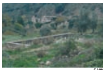
Imagen de la Bassa llarga, una balsa.

Todavía hoy podemos ver en buen estado de conservación la gran Bassa llarga (balsa larga) cerca de la fuente y, bajo los muros de protección del ángulo oeste de la edificación, la Bassa de les Tortgues (balsa de las tortugas). Según la tradición, los monjes criaban aquí estos animales. Con su carne preparada en forma de sopa proporcionaban un alimento reconstituyente para los monjes más débiles.