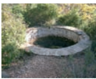
Imagen de una balsa redonda.

Para seguir el recorrido debe tomarse el camino que sale a la izquierda de la edificación. En los primeros 10 metros sube muy empinado por lo que hay que tener cuidado de no resbalar, sobre todo si el suelo está mojado. Enseguida encontramos una balsa redonda, que recoge las aguas del barranco, y a su lado un ciprés centenario digno de ser admirado. A mano izquierda, un sendero ancho nos permitirá volver a la pista agrícola.