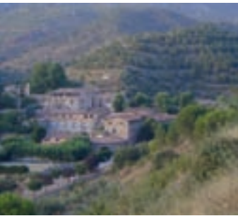
Imagen de la Conreria de Escaladei, una granja.

Al finalizar el itinerario les recomendamos hacer una visita a lo que queda de una de las dependencias más significativas de las cartujas: la Conreria (granja). Se encuentra a un kilómetro, y se accede por la pista asfaltada que permite el acceso motorizado al monumento. Situada a la entrada del valle, la Conreria controlaba el acceso a las dependencias claustrales de la cartuja y al mismo tiempo constituía una unidad de producción agrícola. Fue edificada en la misma época que el monasterio. En torno a una gran plaza se encontraba la Casa de la Procura habitada por el padre procurador o conrer , y por los hermanos donatos. Cerca de ella todavía hoy encontramos la iglesia de la Mercè que acogía las celebraciones litúrgicas de los religiosos y de los menestrales al servicio de la cartuja. En sus orígenes era una capilla románica de una sola nave con ábside y campanario de espadaña.