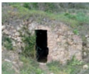
Imagen de Font del Manítral, una fuente de piedra.

Un complejo sistema hidráulico, formado por diversas balsas y canalizaciones, aseguraba la distribución de agua corriente en todas las celdas y en diversas dependencias comunales de la cartuja. Un sistema de acequias permitía la llegada del agua necesaria a la Conreria (granja de la cartuja), situada a más de un kilómetro y a los huertos.