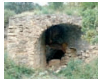
Imagen del antiguo horno de cal.

A la izquierda de la pista podemos ver una construcción semiderruida, testimonio del que había sido uno de los muchos hornos de cal propiedad del monasterio.