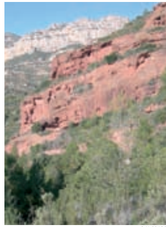
Imagen de Coves Roges, un barranco con rocas rojas.

La bajada que recorre el fondo del barranco de Font Pregona nos ofrece una impresionante perspectiva aérea de las ruinas de Escaladei. La grandiosidad que todavía conserva el recinto nos permite imaginarnos la importancia histórica y arquitectónica que adquirió el monasterio en sus años de esplendor.