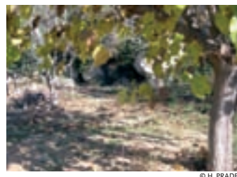
Imagen del camino ancho.

Probablemente, era el antiguo camino de los Cartujos, que unía el monasterio con todos los pueblos situados en la falda del Montsant. Este camino era la vía de comunicación entre el monasterio y las poblaciones vecinas. Estaba conectado con otros senderos que permitían a los monjes llegar a las ermitas y a otras posesiones que tenían cerca de los pueblos. Para iniciar el regreso al monasterio, hay que volver a cruzar la pista y tomar el mismo sendero que a la ida. Esta vez seguiremos por el camino ancho sin coger ningún desvío.