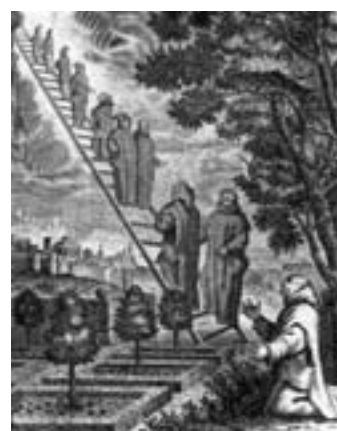
Grabado del siglo XVIII que recoge la leyenda de la visión del rey Alfons I, que originó la fundación de Escaladei.

Por encima de las ruinas de la cartuja sobresalen y nos rodean las paredes de conglomerado que sin duda cautivaron a los monjes cartujos, y que hoy siguen cautivando a los caminantes. Al llegar al collado podremos contemplar la extensión de los riscos que se extienden a nuestra derecha en dirección a La Vilella Alta. La escalera de Dios (Scala Dei) que conducía a los ángeles hasta el cielo es fácil de imaginar en este paraje. Todo indica que el sueño que el pastor explicó a los enviados reales que buscaban un lugar para ubicar la cartuja tiene su origen en los pasos que permiten superar el desnivel de los riscos. En plenos riscos, y cerca de este lugar, se encuentra el conocido Grau de l'Escltxa (paso de la Grieta) con unos escalones tallados en la roca que se atribuyen a los cartujos y con una pequeña cavidad a sus pies, que la tradición