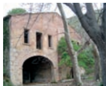
Imagen de la Pietat, un edificio ruinoso.

Las actuales ruinas de La Pietat están rodeadas de árboles centenarios que con toda seguridad deben su origen a los cartujos. Son árboles alóctonos, plantados por los religiosos. Algunos con la finalidad de aprovechar sus frutos, como el pino piñonero, y otros para disfrutar de la contemplación de su belleza como el árbol de Judas o árbol del amor, que en pri-