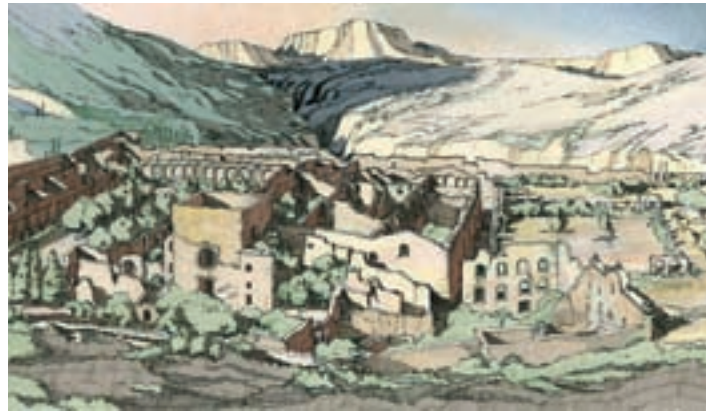
Imagen de la cartuja de Escaladei, tal como quedó después del asalto anticlerical de 1835.