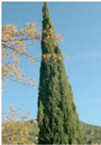
Imagen de un ciprés en el paisaje.

Tras la desamortización pasó a manos privadas y se convirtió en una masía, que contaba con una pequeña ermita. Durante la guerra civil española, el edificio fue utilizado como hospital de campaña. Aunque desgraciadamente hoy en día se encuentra en muy mal estado, nos permite disfrutar de un lugar que todavía conserva muchos restos de su esplendoroso pasado.