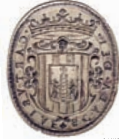
Sello de la cartuja de Escaladei. Principios del siglo XVII.