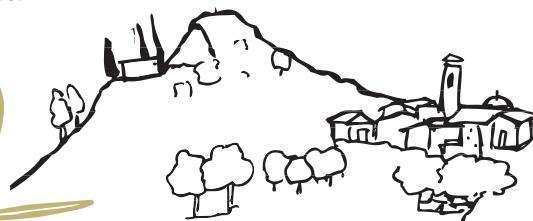
Poble de Marçà, a redós de la Miloquera.

Just abans d'arribar al poble de Marçà vorejarem el Mas d'en Crusat, un dels masos més antics i notables del poble, i que compta amb una capella pròpia dedicada a Sant Marià. En l'actualitat també es conreen els camps del seu voltant, integrats sobretot per vinyes però també amb avellaners i ametllers.