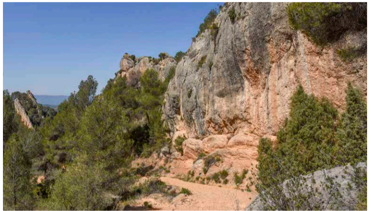
Formacions de conglomerat prop de la Foia.