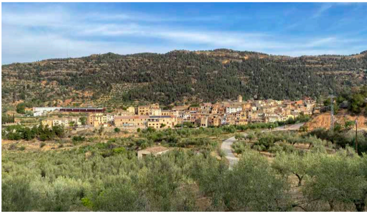
Camps d'olivera a Cabacés.