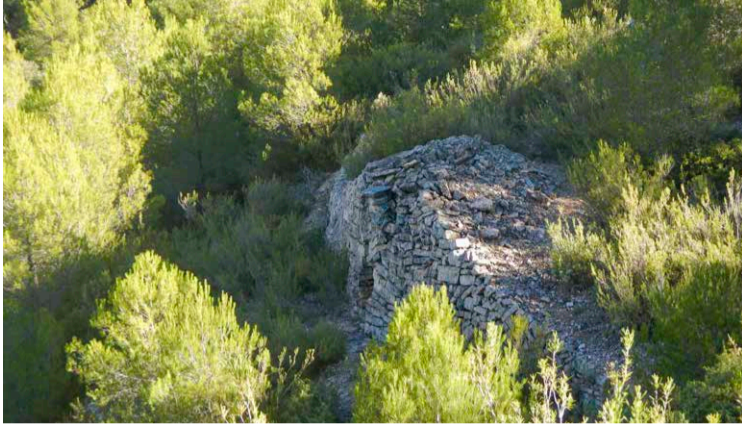
Barraca de marge.