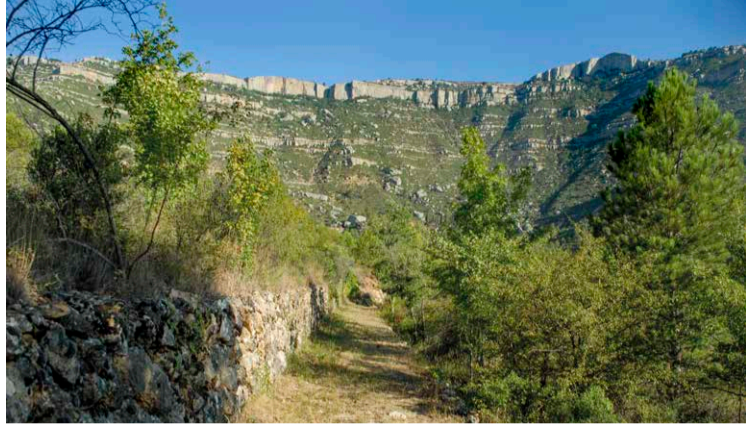
Tram del camí entre marges de pedra seca.