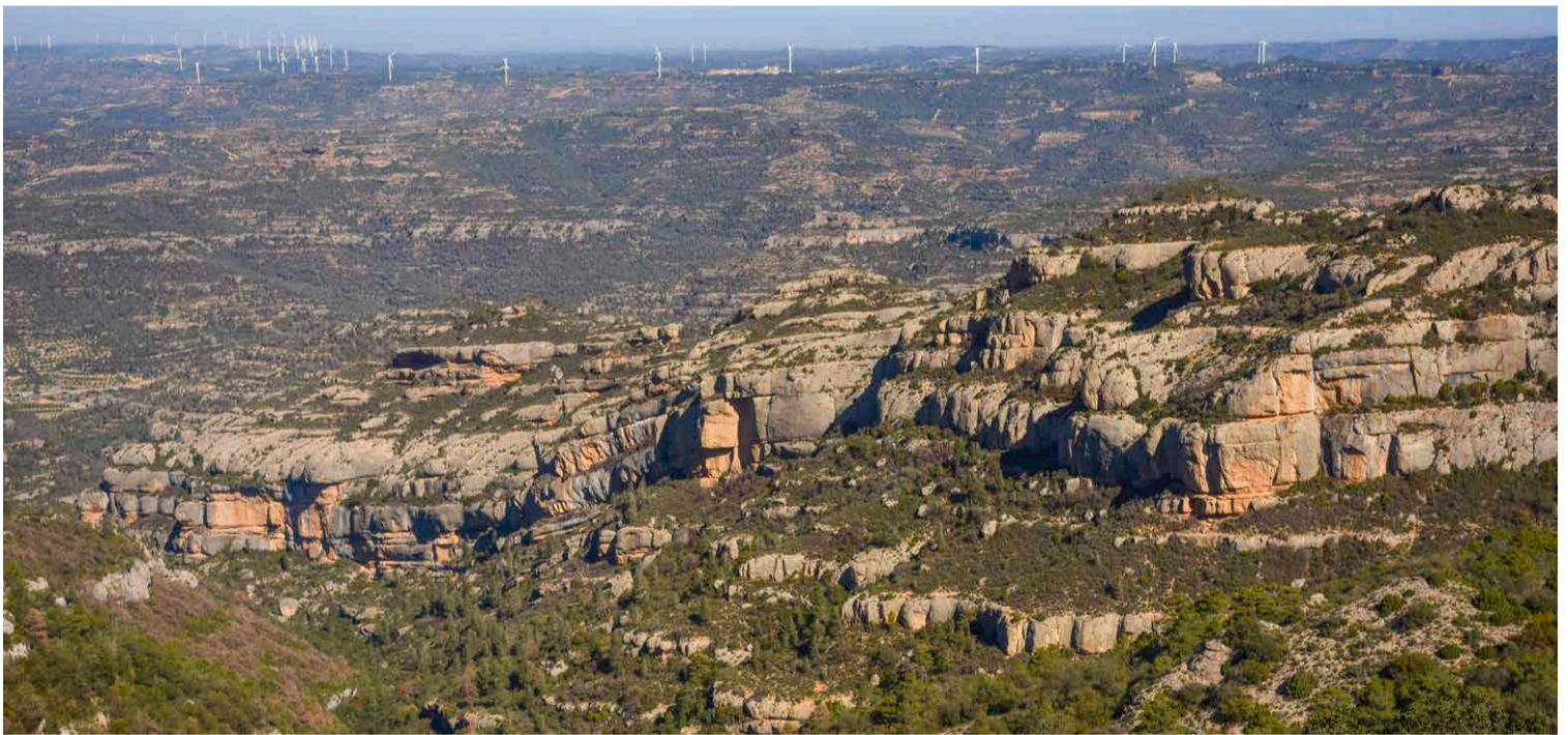
Vistes des de la Serra Major.