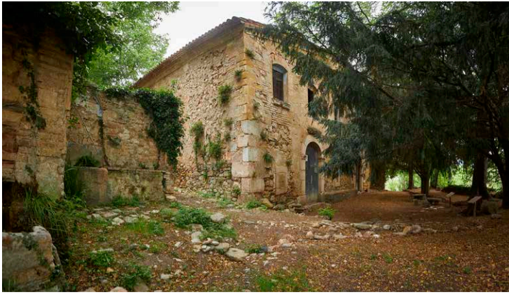
Mas de Sant Blai; cal desviar-se una mica per visitar-lo.