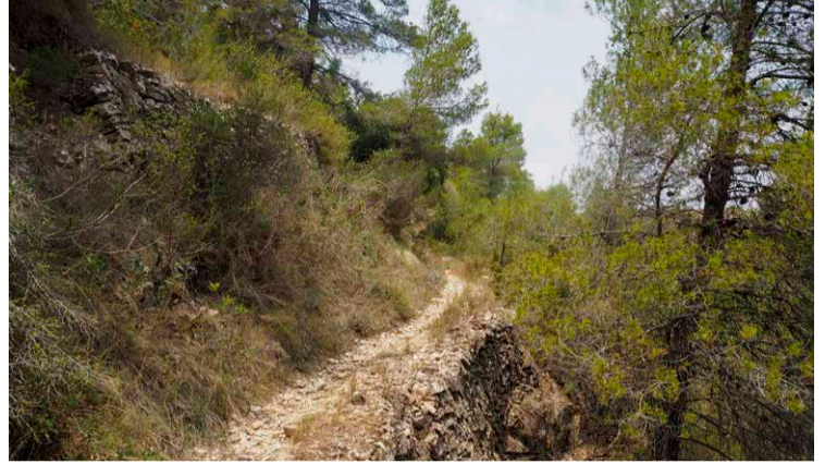
La ruta transcurre por antiguos caminos bien conservados.