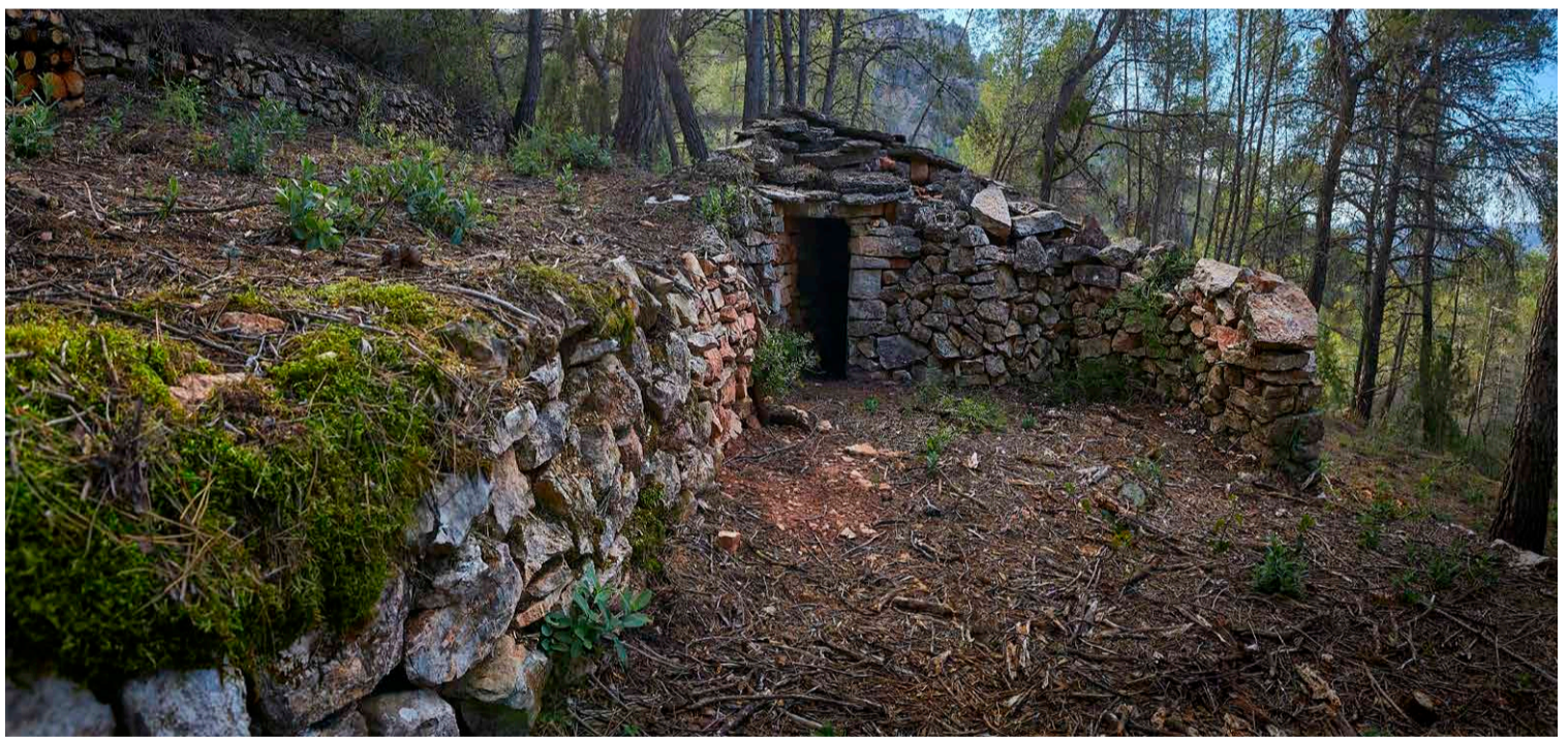
Cabaña de piedra seca al lado del camino.