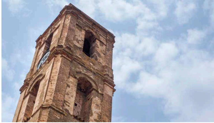
Campanario de la iglesia de Sant Martí.