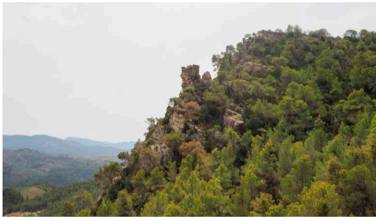
Formaciones rocosas interesantes en los riscos de La Figuera.