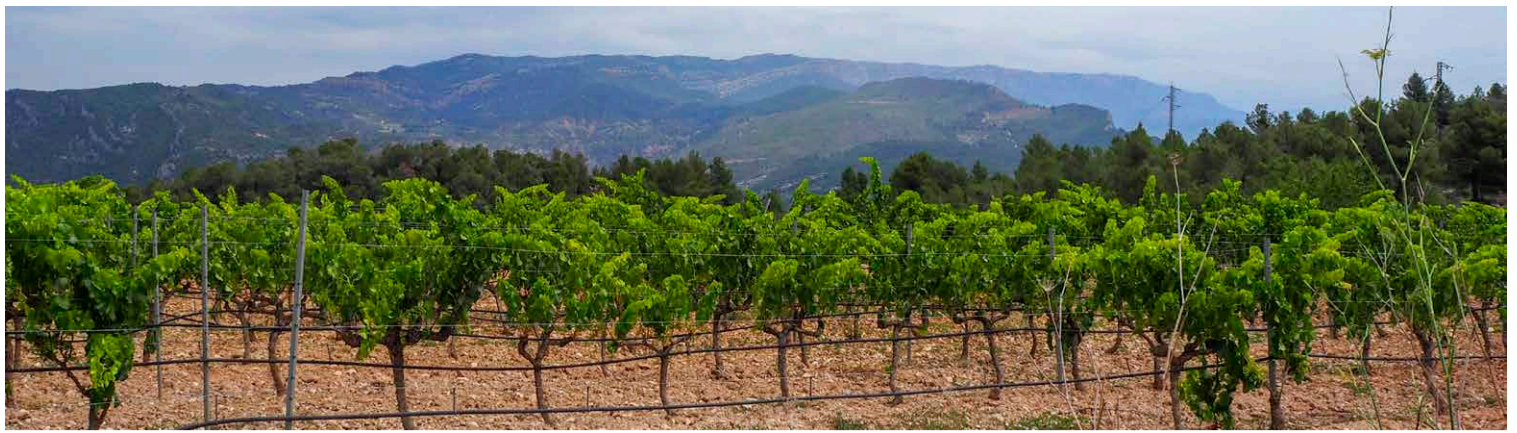
El viñedo es protagonista en algunas partes del recorrido.