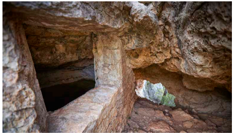
Aljibe con forma de cavidad excavado en la roca.