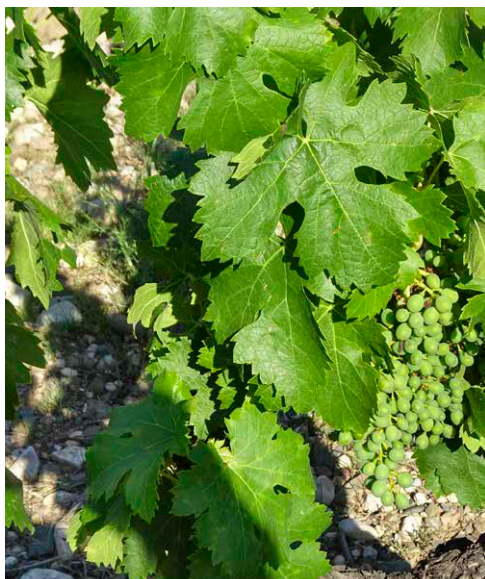
Detall d'un cep.

Construcció de pedra seca propera a Mas Déu.