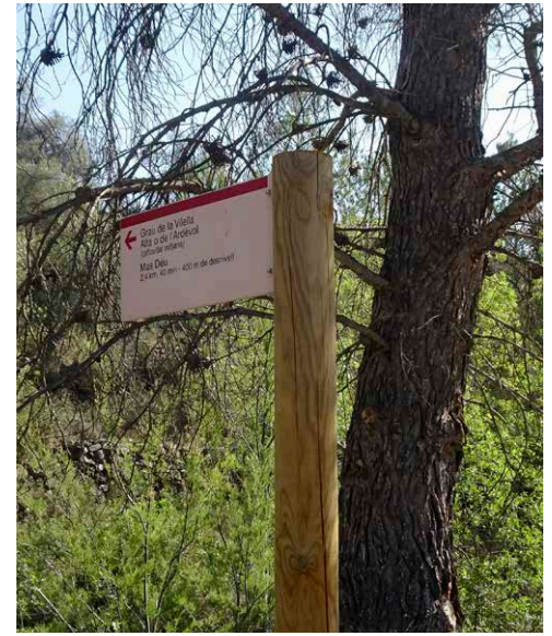
Senyalització vertical amb banderola.