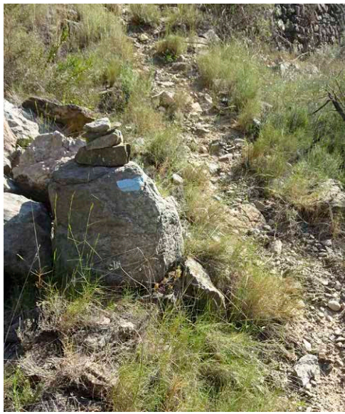
Fita de pedres.