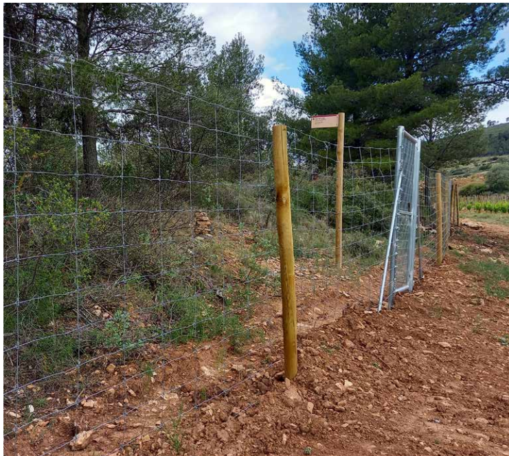
La ruta voreja camps de vinya; deixeu les portes tancades.