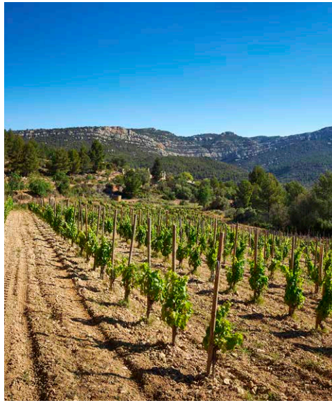
Les vinyes són un dels elements protagonistes al Priorat.