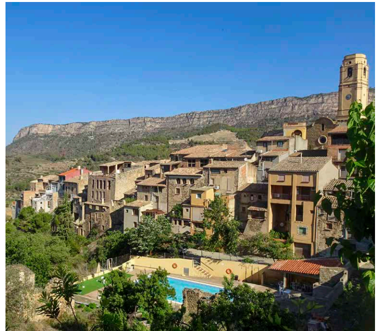
La Vilella Alta, o també coneguda com la Vilella de Dalt.